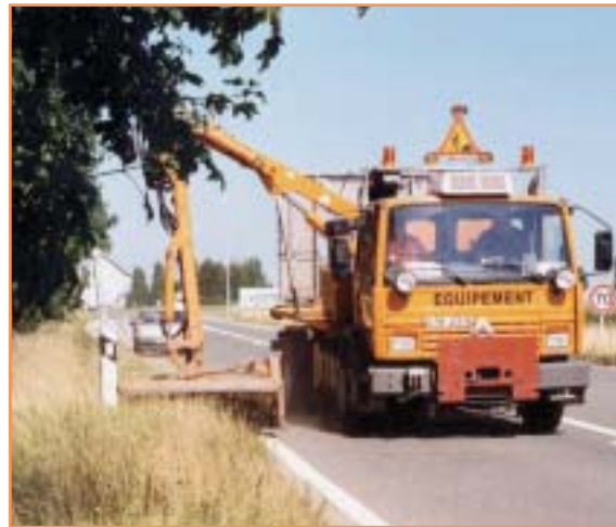
Le parc matériel de la DDE du Bas-Rhin loue ses machines aux 16 subdivisions du département.