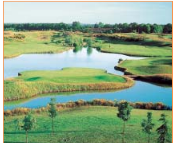
En octobre 2002, la Fédération française de golf enregistrait une augmentation de + 8 % du nombre de licences délivrées par rapport à l'année dernière.