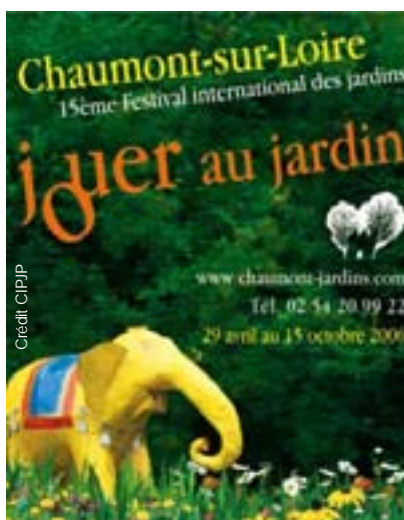
Le festival des jardins de Chaumont-sur-Loire (41) draine chaque année plus de 150 000 spectateurs. Sa devise : « venez piquer nos idées »